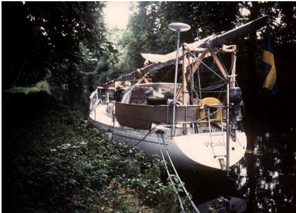
Naturen i de franska kanalerna.

Jag har just nu i skrivande stund gjort en del beräkningar och det verkar som om vi har stoppat i Vitalia ca: 350 liter dieselolja under dessa två månaders körning.