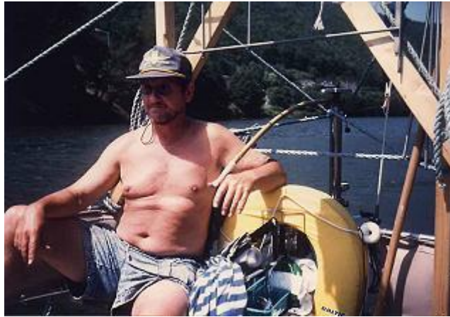
Det var bekvämt att styra med hjälp av vindrodret. Egen uppfinning! (Kanske något för Balladklubbens Praktiska tips!)