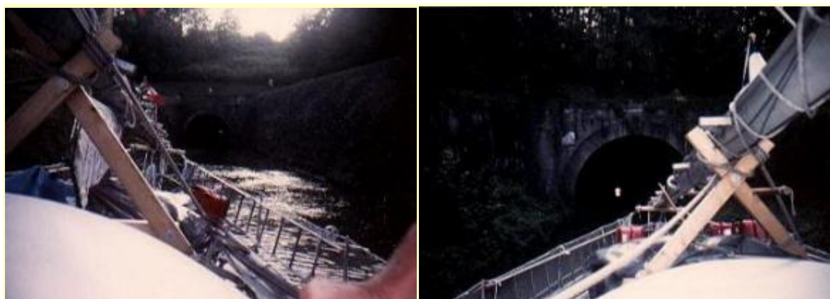
En av kanaltunnlarna

Den riktiga resan började faktiskt inte förrän vi inträdde i Frankrike. Vitalia gjorde inträdet på platsen Givet. Där fick man stanna kvar i slussen tills man hade betalt en viss bestämd avgift som beräknades på båtens storlek och den tidslängd som man skulle stanna i landet. Det kostade oss ca: 800:- fr. (Ballad 30 fot.) när vi uppgav att vår färd genom Frankrike skulle ta 1 månad. Nu räckte inte tiden till för den färden men det heter också att det bara är dagarna som man kör båten som skall räknas och dessa dagar skall man själv notera i ett speciell häfte som ingen gör!?