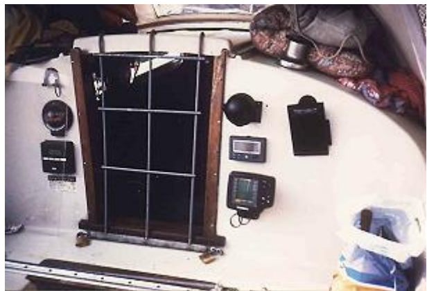
Det var säkrast att skydda sig för tjuvar.

Transportsträckan genom Tyskland är lång och ganska händelselös, rent av tråkig. Men eftersom den var i början av vårt äventyr så var vi lyhörda och sökte efter allt som kunde leda till spänning och underhållning i vårt motorputtrande. Därför klarar man av den långa och mödosamma resvägen. Problemet är att det inte alltid finns någonstans att lägga till när man så önskar. Om det i ödemarken finns någon plats där man vill gå i land för att t ex handla i en butik, då är det nästan säkert att det står en P-skylt förbjudet att lägga till. Jag kan lova att det finns gott om de blå polisbåtarna som ser till att man efterlever de förbudsmärken som så