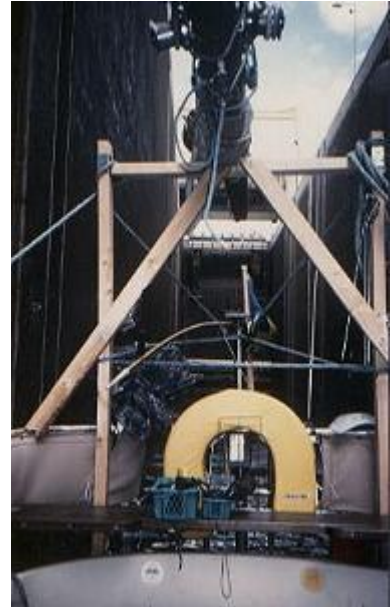
Så här såg träkonstruktionen ut som bar upp Balladmasten.

Vi hamnade på några platser till i den danska övärlden och gjorde oss ingen brådska. Den sista anhalten i Danmark blev dock Gedser. Där tvingades vi att stanna några dagar i väntan på bättre väder. En underbar och snabb segling över till Travemünde, mat på restaurang hamnliggande strax intill de stora båtarna som nu snart säljer sina sista skattefria cigaretter och whiskeyflaskor inför den nya Europeiska lagen. Dagen efter söker vi upp en liten hamn inne i Lübecks kanalsystem och vi avmastar Vitalia, endast 20 DM. Masten surras och slås med rep på en sinnrik träkonstruktion ovanpå båten med masttoppen riktad framåt och något nedåt samt den längst utstickande delen i fören. Allt detta enligt andras tidigare erfarenheter. Långt senare i Belgien monteras det på ett mindre bildäck på masttoppen. Det kändes skönt att bli av med hela vår last av timmer som vi släpat med oss på däck. Nu slapp vi alla frågor från folk, vi mött om vi var ett transportfartyg inom virkeshandeln.