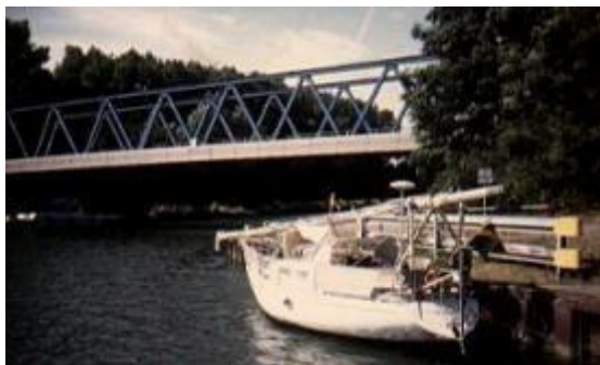
I väntan på broreparation.