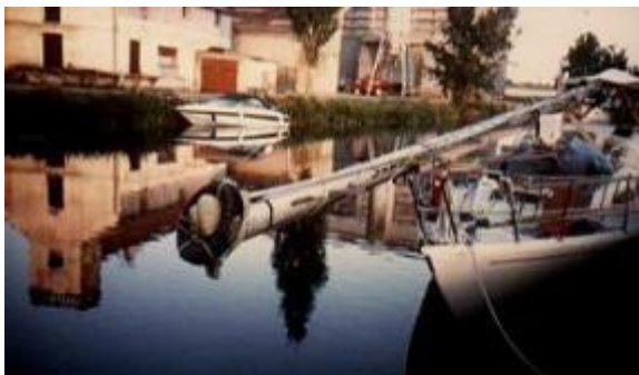
Här är vi hamnliggande på grund.

det förekommit flera liknande situationer där masten skakats av och andra dramatiska saker inträffat i samband med vilda Rhenfärder vid högvattennivå.