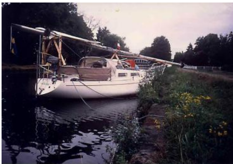
Den långa Balladmasten var ibland besvärlig.

Jag har aldrig i hela mitt liv gått in i en sluss med egen båt. Jag tänkte att det är inget problem för två gamla veteraner som vi var. Det stämde i och för sig med den slutsatsen, men vad vi inte förstod oss på, det var just pråmskepparnas beteende i slussarna. Jag hade läst och satt mig in i signalsystemet och visste klart och tydligt om hur hela slussprocessen gick till.